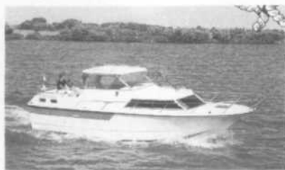
Marco 860 AK