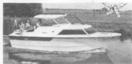
Marco 810 AK

Als u ook de beslissing hebt genomen om gezond en ontspannen te rekreëren en toch tijdens week-end en vakantie actief te genieten en er echt uit te zijn, dan biedt het water in Nederland nog ongekende mogelijkheden.