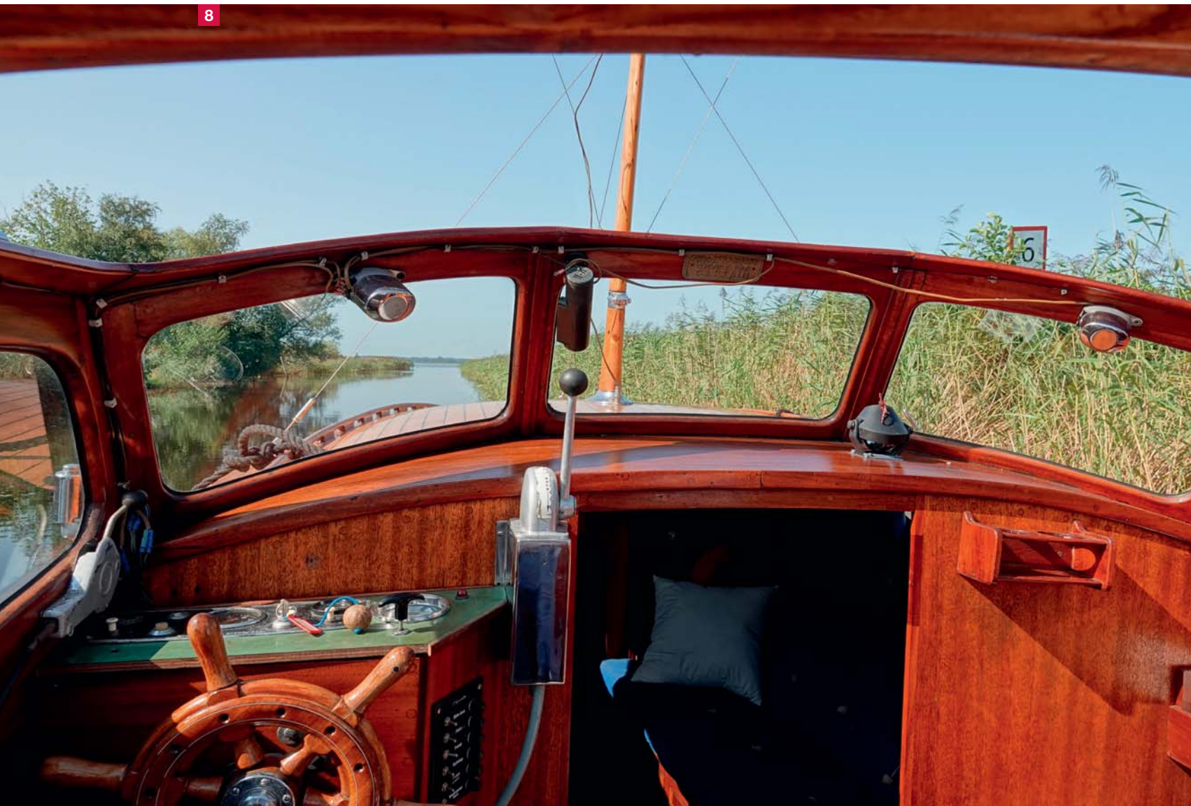
8 De eenvoudige, maar functionele stuurhut.

toch vooral functioneel. Zeventig jaar zorgvuldig gebruik geven een mooi patina. In de kuip herkennen we ook de bekende Noorse uitklapkeuken, die we later op veel polyester spitsgatters terugvonden. In het roefje zijn er twee